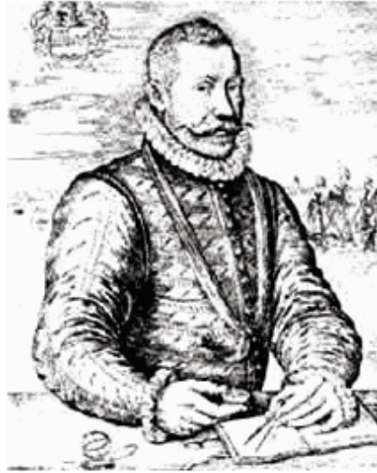
Willem Bloys van Treslong