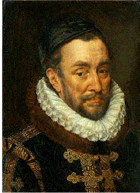
Willem van Oranje