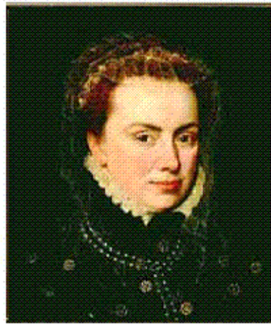
Margaretha van Parma