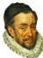
- Willem van Oranje