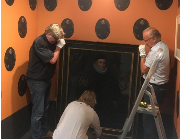
Inrichting tentoonstelling De vrouwen van Willem van Oranje

Voor de tentoonstelling "De Vrouwen van Willem van Oranje" werden tijdelijke bruiklenen verkregen van het Haags Historisch Museum Den Haag, Koninklijke Verzamelingen Den Haag, het Marechausseemuseum Buren en het Streekarchief Voorne-Putten te Brielle.