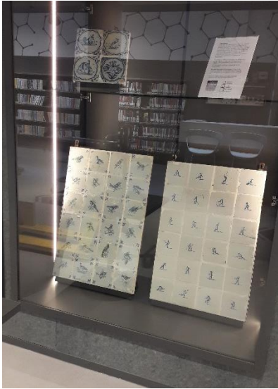
Vitrine in Cultuurhuis