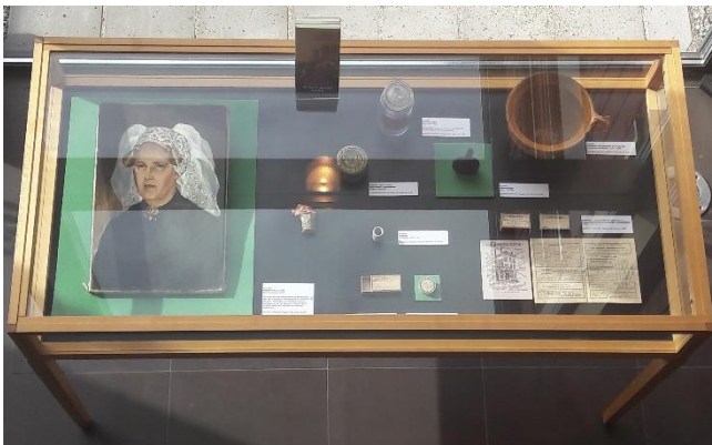
Vitrine Medisch Centrum Brielle