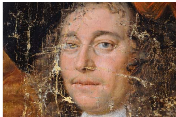
Na het afnemen van vernislagen, retouches en overschilderingen. Dieptewerking, kleur en detaillering worden weer zichtbaar.