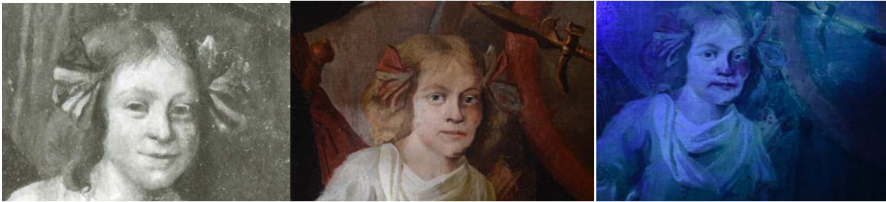
Voorstelling rond 1916 fluorescentie

eeuw nog een aantal malen onder handen genomen moest worden. Voorstelling is hierdoor steeds verder af komen te van het origineel.