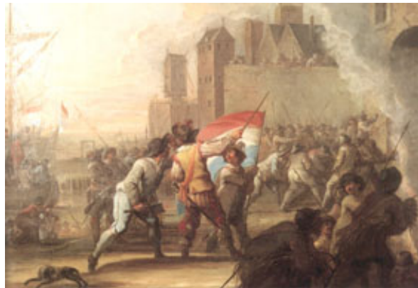
Inname van Den Briel - J. Keller, 1759 Historisch Museum Den Briel

De opperbevelhebber van de geuzen was Willem II Lumey van der Marck, of in het kort gewoon: (graaf van) Lumey. Waarschijnlijk was hij één van de bekendste admirala's van de Watergeuzen. In 1566 was hij nog een Zuid-Nederlandse edelman en één van de ondertekenaars van het Smeekschrift der Edelen dat aan Margaretha van Parma aangeboden werd. Later werden zijn bezittingen verbeurd verklaard en werd hij verbannen. Hierna sloot hij zich aan bij de Watergeuzen.