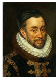
(Willem van Oranje: In zijn jaren als stadhouder en als leider van de opstand)

In 1567 besloot Willem uit te wijken naar zijn geboorteplaats Dillenburg. Alva had ondertussen een raad opgesteld om opstandelingen te vervolgen, de Raad der Beroerten. De Raad der Beroerten besloot Willem te vervolgen wegens rebellie (vanwege zijn uitspraken tegen de koning) en verklaarde al zijn bezittingen in Nederland (toen al miljoenen euro's waard!) verbeurd. Vanaf 1568 probeerde Willem van Oranje Alva te verdrijven. Willem begon troepen te vormen in Duitsland, nam het